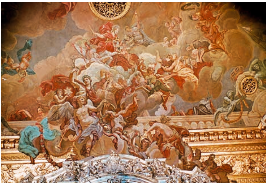
Abb. 2 (links): Johann Friedrich Wentzel: Apotheose Preußens (um 1705). Detail der südlichen Deckenzone mit der Darstellung der Borussia im ehemaligen Ritteraal des Berliner Stadtschlosses. Aufnahme von 1943/45.